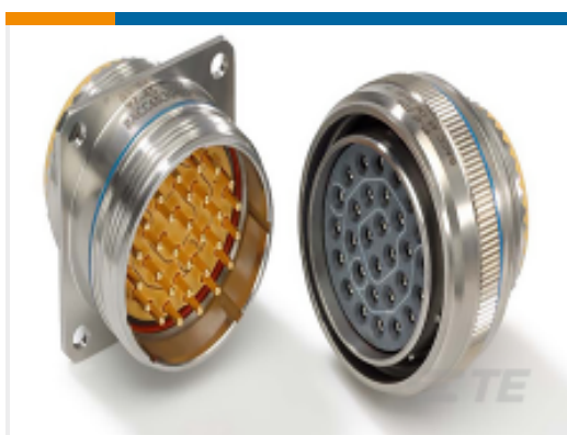
TE 产品编号 ZPF000000000008052 983-3KE-N 14