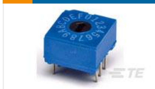
TE 产品编号1825008-2 DRD10RAE04=Rot Dip,R/A