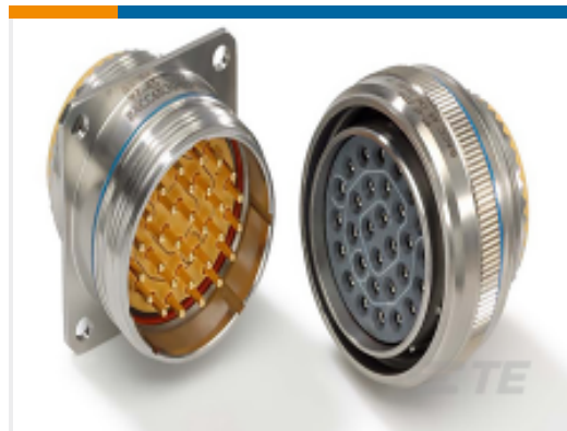
TE 产品编号ZPF000000000037034 983-6SE 18-08 S9