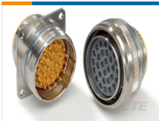
TE 产品编号ZPF000000000008602 983-6S 14-07 PN