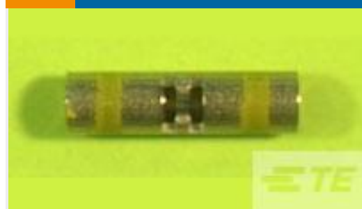
TE 产品编号680334-000 D-609-14