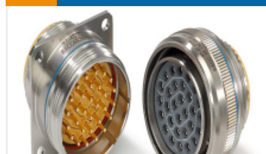
TE 产品编号ZPF000000000008015 983-1Y 10-06 PN