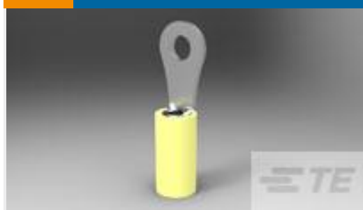
TE 产品编号323914 TERMINAL,PIDG R 26-22 4