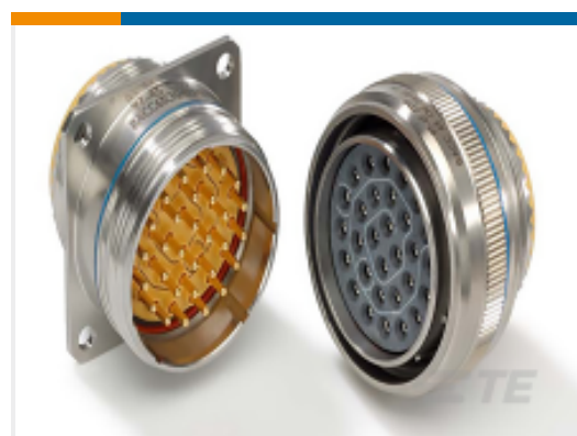
TE 产品编号 ZPF000000000008043 983-3KE-C 14