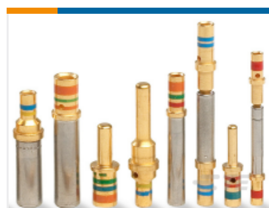
TE 产品编号 ZPF000000000001197 097-0013-16