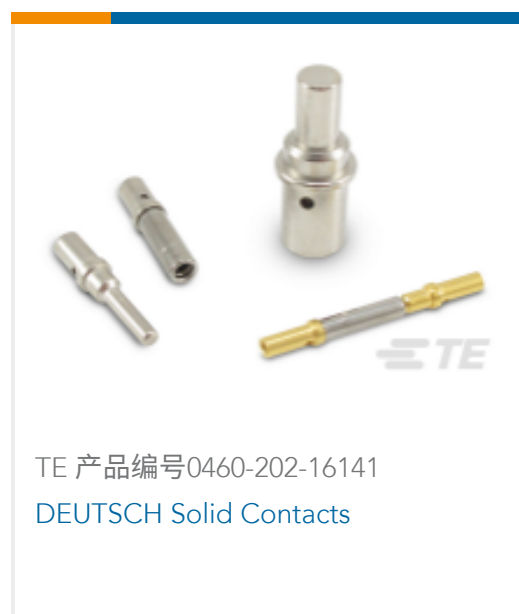
TE 产品编号0460-202-16141 DEUTSCH Solid Contacts