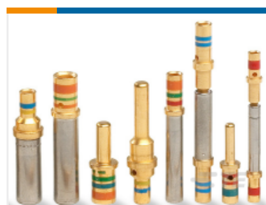
TE 产品编号 ZPF000000000001201 097-0015-20