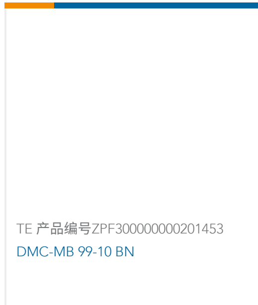
TE 产品编号ZPF300000000201453 DMC-MB 99-10 BN