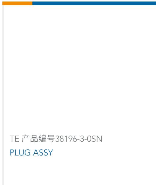
TE 产品编号38196-3-0SN PLUG ASSY