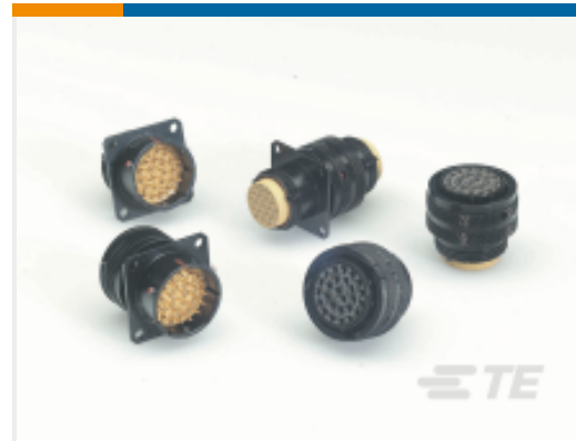
TE 产品编号ZPF00000000020097 FDBA 57-8-98 SN-K-A5610