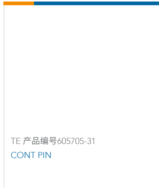
TE 产品编号605705-31 CONT PIN