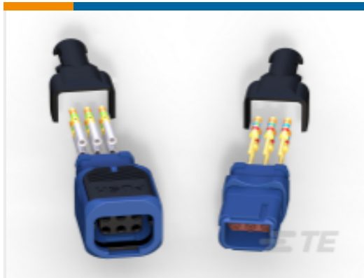
TE 产品编号YD369-HR66-BP00000 369 HARSH 6 WAY REC, PIN - BACC65CR2PB