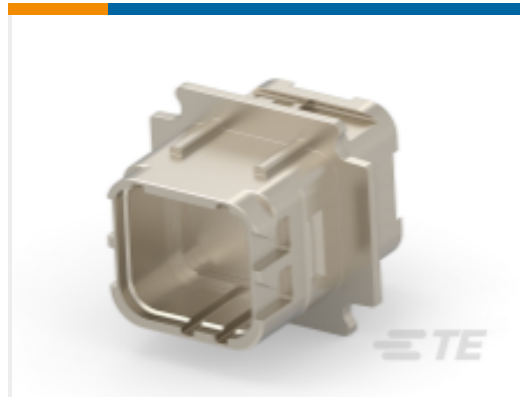
TE 产品编号ZPF000000000104588 Rectangular Connector Receptacle Extenders, Tool-less Assembly