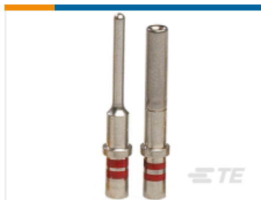
TE 产品编号ZPF000000000000431 006-1187-20 TRA