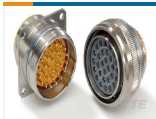
TE 产品编号ZPF000000000098489 983-15 KV 4-12-03 PN-L