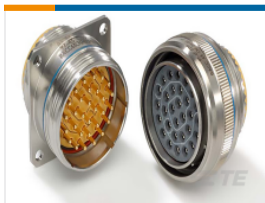
TE 产品编号ZPF200000000008756 983-6SE 10-05 SN-L