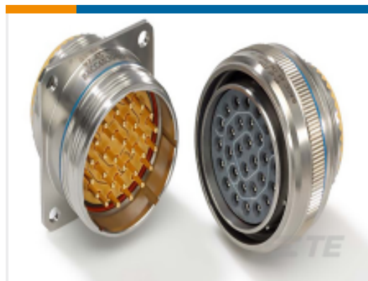
TE 产品编号ZPF000000000007504 983-0SE 10-06 PN