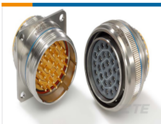
TE 产品编号ZPF000000000114004 983-15 KV 4-18-31 S6 L