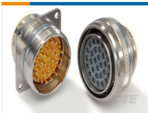
TE 产品编号ZPF000000000007500 983-0SE 10-06 P6