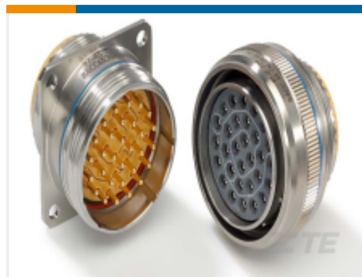
TE 产品编号ZPF000000000007464 983-0SE 08-03 PN