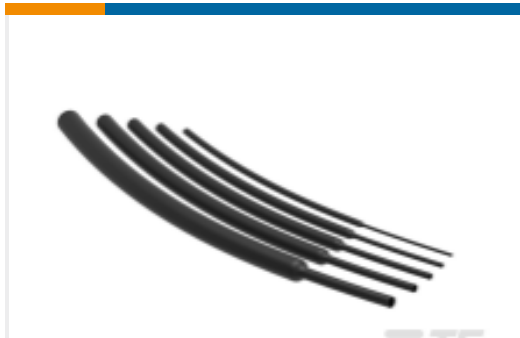
TE 产品编号5053342033 RNF-100-0 热缩管