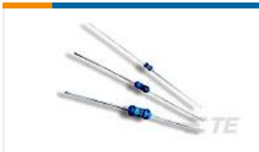
TE 产品编号1622308-1 LR1 1% 120R