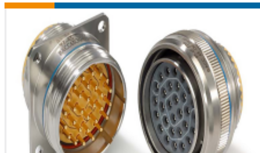
TE 产品编号ZPF000000000007301 983-0S 08-03 P6