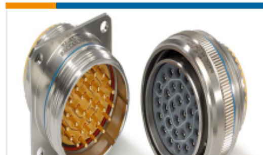
TE 产品编号ZPF000000000007310 983-0S 08-03 S6