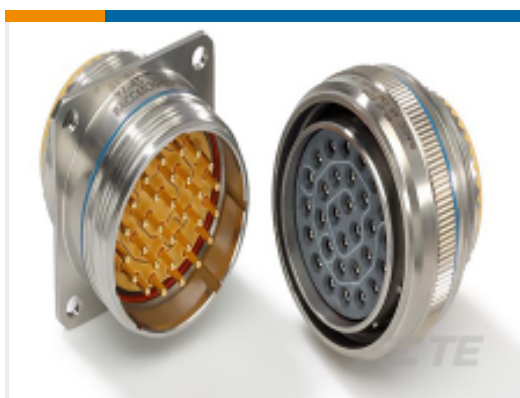
TE 产品编号ZPF000000000007706 983-0SE 22-55 PN