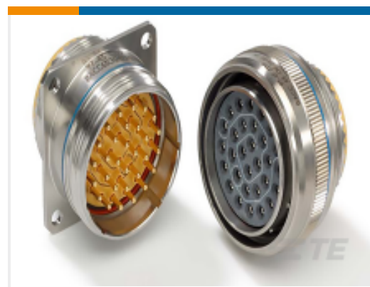
TE 产品编号ZPF0000000000007174 983-ORS 08-98 PN