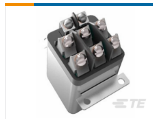
TE 产品编号1617807-5 FC-335-SY8= RELAY, 3PST