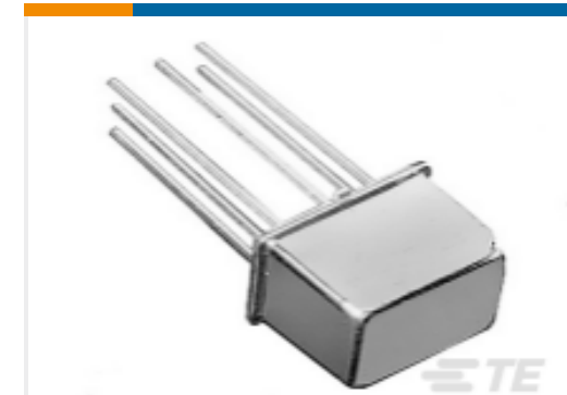
TE 产品编号1617147-5 JMGAP-26P = M39016/17-030P