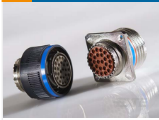
TE 产品编号ZPF000000000016119 DTS 20 K 15-19 PN