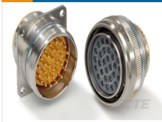
TE 产品编号ZPF000000000007404 983-0S 18-31 P6