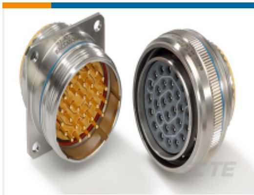
TE 产品编号ZPF0000000000033326 983-0S 18-08 SN