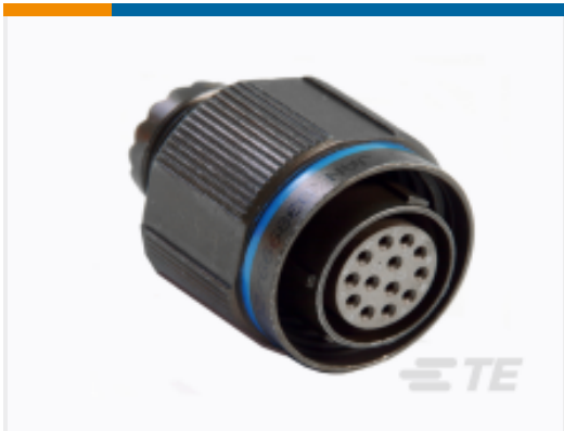
TE 产品编号YDTS26F19-32SNV001 PLUG ASSY