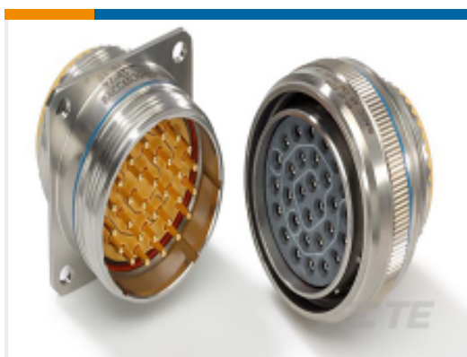
TE 产品编号ZPF000000000008886 983-6SE 16-24 PN