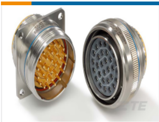
TE 产品编号ZPF000000000007429 983-0S 20-41 PN