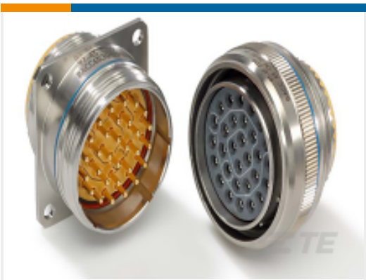
TE 产品编号ZPF000000000008625 983-6S 16-24 PN