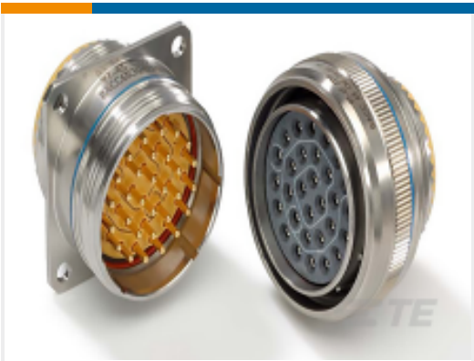
TE 产品编号ZPF000000000007313 983-0S 08-03 SN