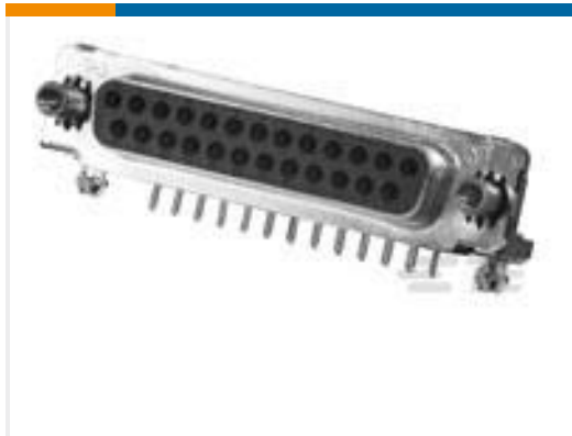
TE 产品编号747847-4 37 MSFL RCPT RA 318 (IN,FM,BL)