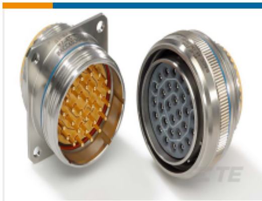
TE 产品编号ZPF000000000007425 983-0S 20-39 SN