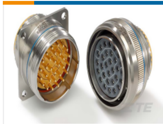
TE 产品编号ZPF000000000007373 983-OS 14-15 P6