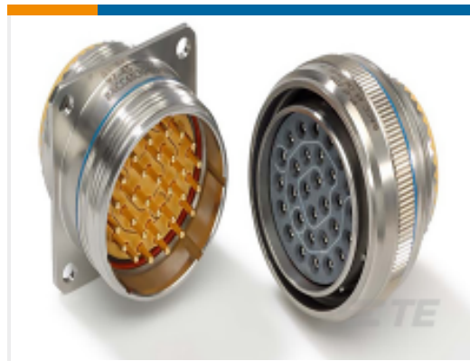
TE 产品编号ZPF000000000007447 983-OS 24-61 P6