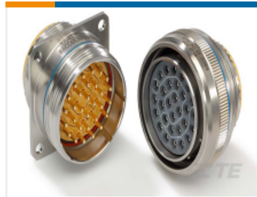
TE 产品编号ZPF000000000007434 983-OS 22-19 PN