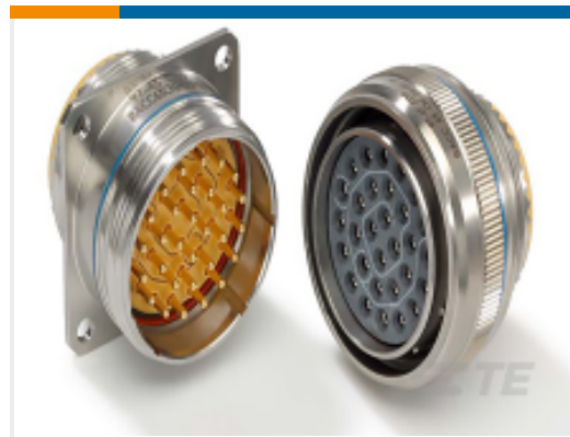
TE 产品编号ZPF000000000008072 983-6K 10-05 S7