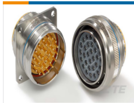
TE 产品编号ZPF0000000000034711 983-6K 12-12 S8