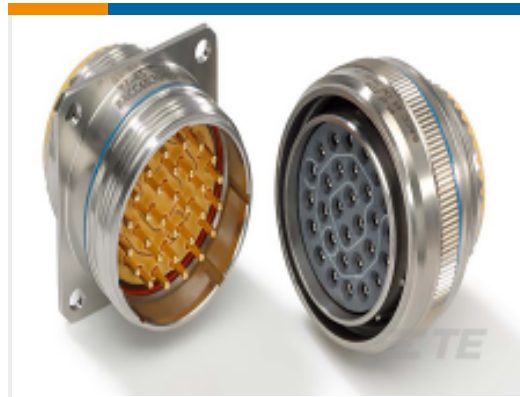
TE 产品编号ZPF000000000007406 983-OS 18-31 P7