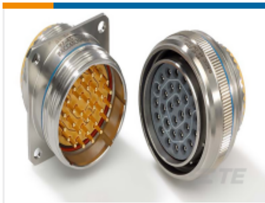
TE 产品编号ZPF000000000007446 983-OS 24-30 SN