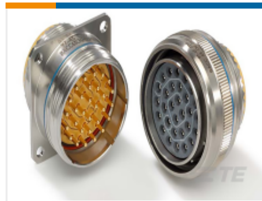
TE 产品编号ZPF000000000007447 983-OS 24-61 P6