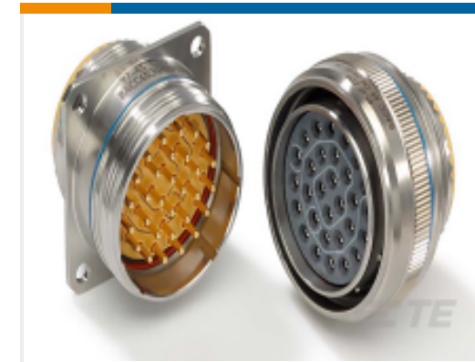
TE 产品编号ZPF000000000007434 983-OS 22-19 PN