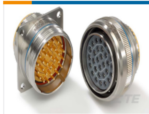
TE 产品编号ZPF000000000007406 983-OS 18-31 P7