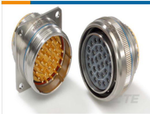
TE 产品编号ZPF000000000007403 983-OS 18-14 SN