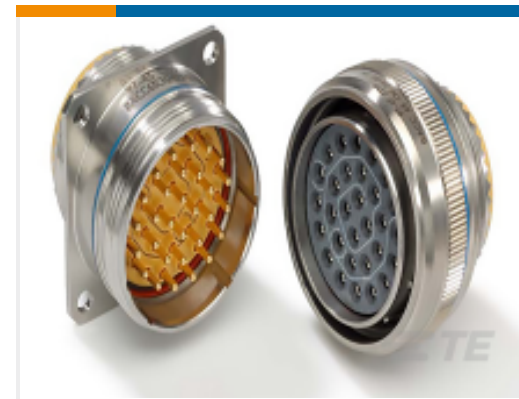
TE 产品编号ZPF000000000008072 983-6K 10-05 S7