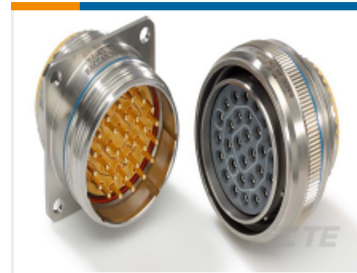
TE 产品编号ZPF000000000007385 983-OS 16-24 P6