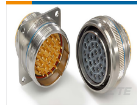
TE 产品编号ZPF0000000000034711 983-6K 12-12 S8