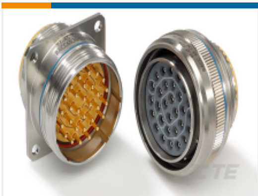
TE 产品编号ZPF000000000122633 983-6SE 10-05 SN-A1208