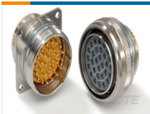
TE 产品编号ZPF00000000033174 983-0S 10-05 P9