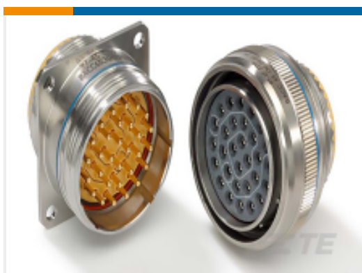
TE 产品编号ZPF000000000122653 983-6SE 20-39 PN-A1208