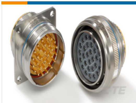
TE 产品编号ZPF00000000033243 983-0S 14-07 S8