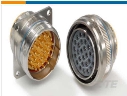
TE 产品编号ZPF000000000122650 983-6SE 18-14 S6 A1208