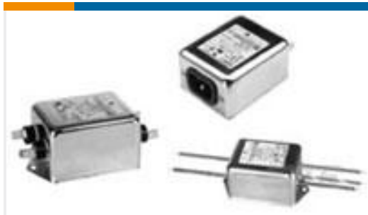
TE 产品编号6609035-5 6ESK1=F7226 S0