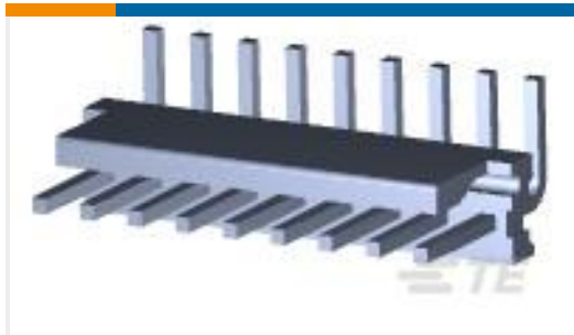
TE 产品编号640387-9 09P MTA156 HDR ASSY SQ R/A