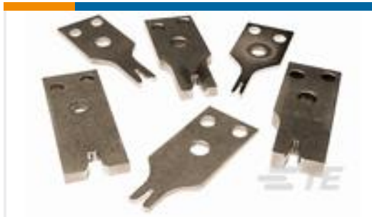
TE 产品编号2-683454-4 CRIMPER, INSUL "O" (.055")