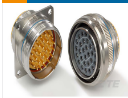
TE 产品编号ZPF100000000007700 983-0SE 22-39 PN-L