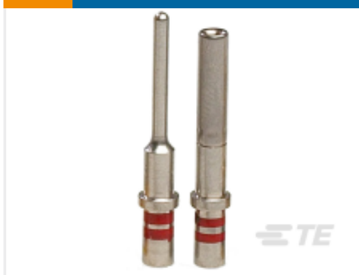
TE 产品编号ZPF000000000001953 182-0298-20