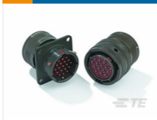
TE 产品编号ZPF000000000006596 951-06 R 16-26 S 50-090