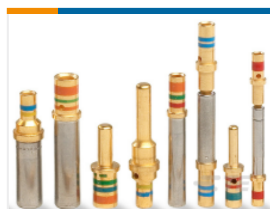
TE 产品编号 ZPF000000000000345 006-0912-20 A