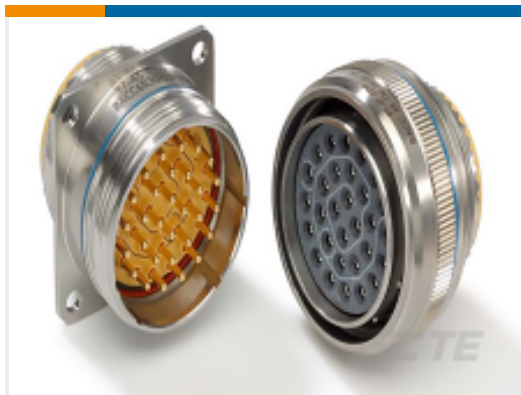
TE 产品编号ZPF0000000000008625 983-6S 16-24 PN