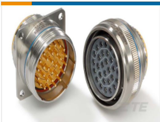
TE 产品编号ZPF0000000000008089 983-6K 12-03 SN