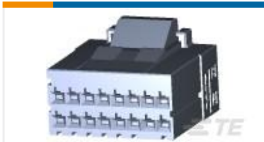
TE 产品编号1-1318118-8 DYNAMIC D-2100 REC HSG 16P X-KEY