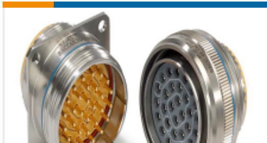
TE 产品编号ZPF000000000007393 983-0S 16-24 SN