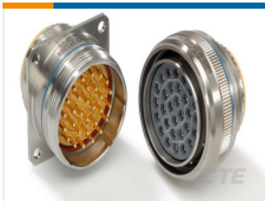
TE 产品编号ZPF0000000000007470 983-0SE 08-03 S6 L