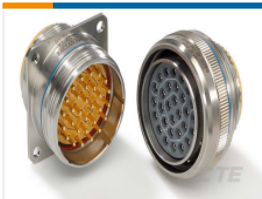
TE 产品编号ZPF0000000000007552 983-0SE 12-12 SN-L