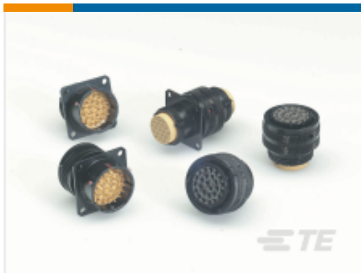
TE 产品编号ZPF000000000019149 FDBA 56-12-10 SN-K-A499