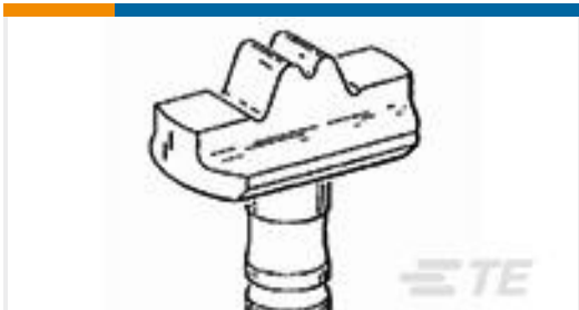
TE 产品编号48127 HYP8 SOLIS 6-2AWG INDENTER