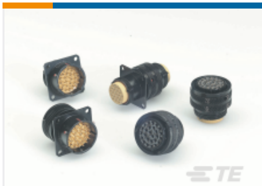
TE 产品编号ZPF000000000019840 FD8A 57-10-6 SN-K 090 A838