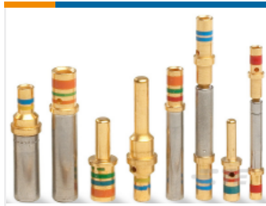
TE 产品编号ZPF000000000003598 724-0003-20