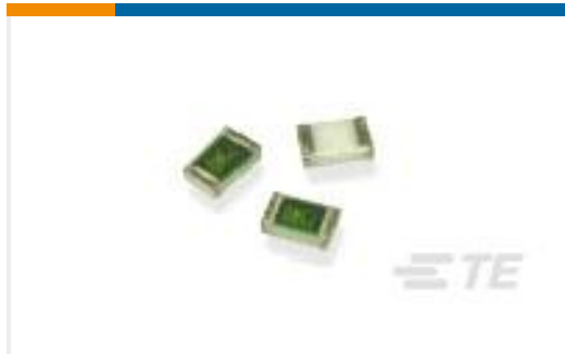
TE 产品编号1676365-2 RN 0805 51K1 0.1% 10PPM 1KRL