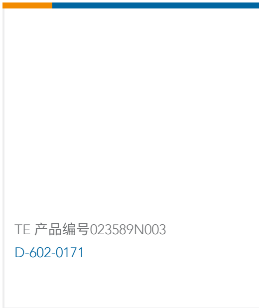
TE 产品编号023589N003 D-602-0171