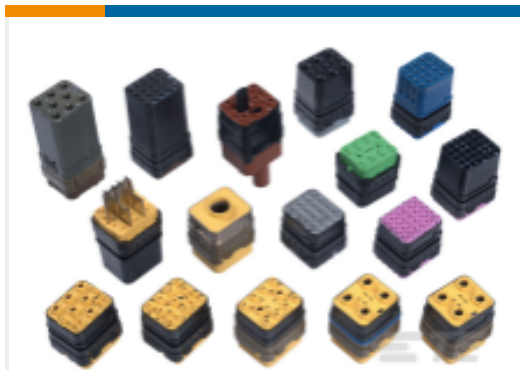
TE 产品编号ZPF000000000015248 DMC-M 12-20 AA