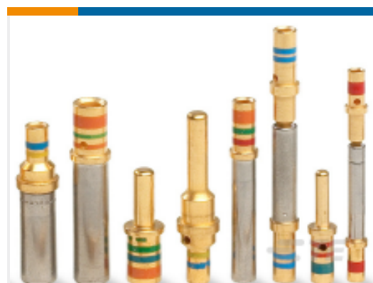
TE 产品编号ZPF000000000000359 006-0937-16