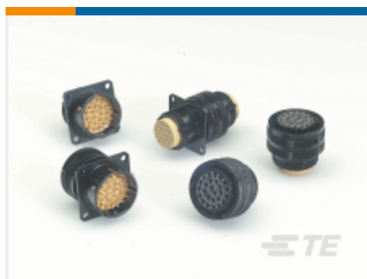
TE 产品编号ZPF000000000096152 FDBA 53H 12-10 PN-K