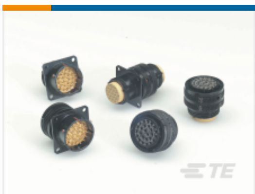
TE 产品编号ZPF00000000018765 FDBA 50H 22-41 PN-K