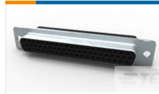
TE 产品编号1658684-1 HDP-22, RCPT, SIZE 4, 62 POSN