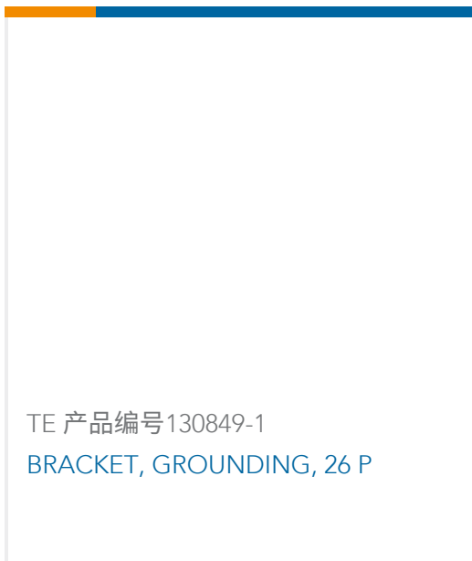
TE 产品编号130849-1 BRACKET, GROUNDING, 26 P