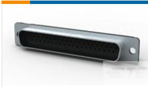
TE 产品编号1658673-1 HDP-22, PLUG, SIZE 4, 62 POSN