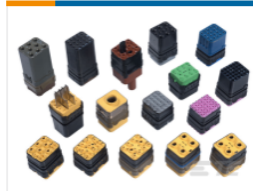
TE 产品编号ZPF000000000015218 DMC-M 08-16 AN