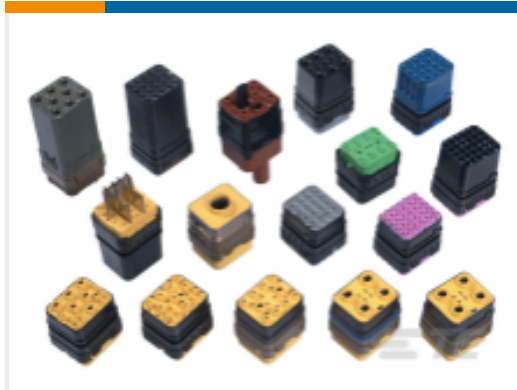
TE 产品编号ZPF000000000015226 DMC-M 08-16 BN