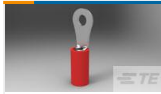
TE 产品编号320553 PIDG R 22-16 COMM 22-18 MIL 4