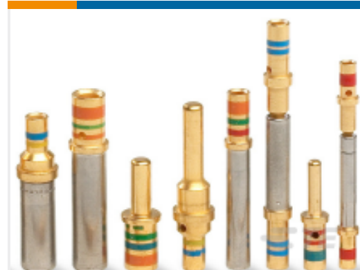
TE 产品编号ZPF000000000003607 724-0007-22