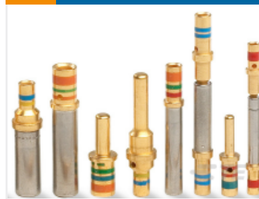
TE 产品编号 ZPF00000000003607 724-0007-22