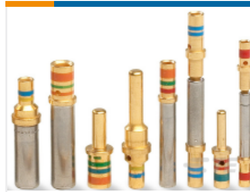
TE 产品编号 ZPF00000000000363 006-0937-20