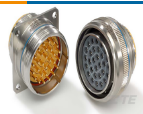
TE 产品编号 ZPF100000000007608 983-0SE 16-24 PN-L