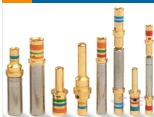
TE 产品编号 ZPF00000000003604 724-0007-16