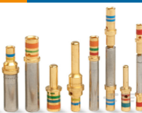
TE 产品编号 ZPF00000000001964 182-0400-16