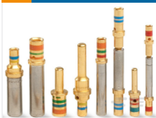
TE 产品编号 ZPF00000000001199 097-0014-16