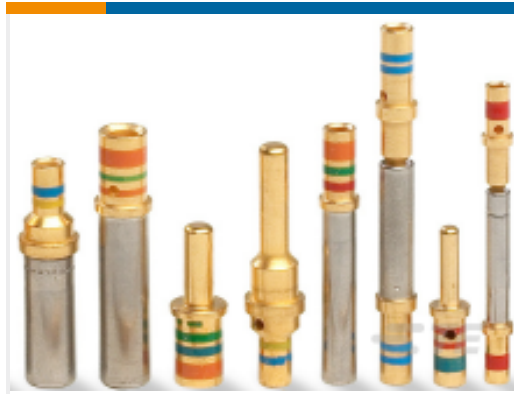
TE 产品编号 ZPF00000000000336 006-0912-16