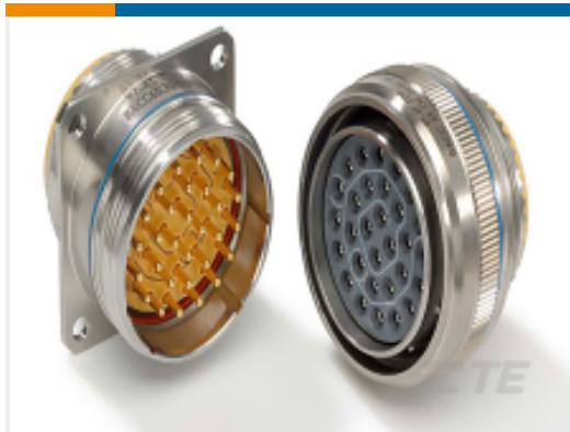
TE 产品编号 ZPF100000000007492 983-0SE 10-05 PN-L