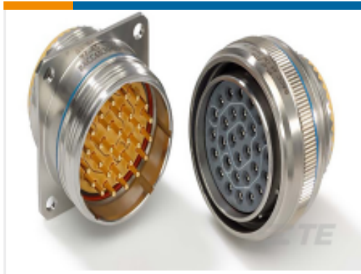
TE 产品编号 ZPF100000000007604 983-0SE 16-24 P6 L