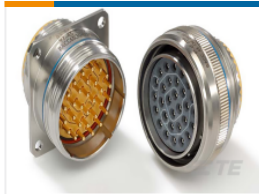
TE 产品编号ZPF000000000104316 983-15 SE 7-10-05 PN-L