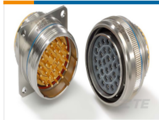
TE 产品编号ZPF100000000008809 983-6SE 12-12 S7 L