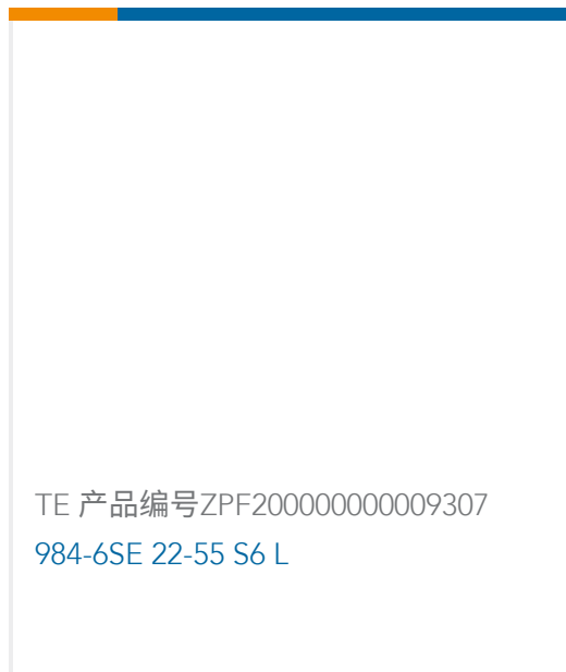
TE 产品编号ZPF200000000009307 984-6SE 22-55 S6 L