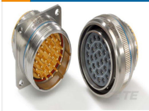
TE 产品编号ZPF100000000009142 983-7SE 16-24 PN-L