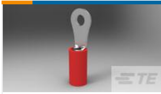
TE 产品编号320553 PIDG R 22-16 COMM 22-18 MIL 4