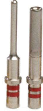
TE 产品编号ZPF000000000000595 025-0402-20