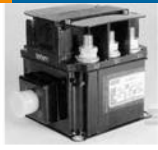
TE 产品编号1616005-1 B4291 (FAA/PMA)=RELAY