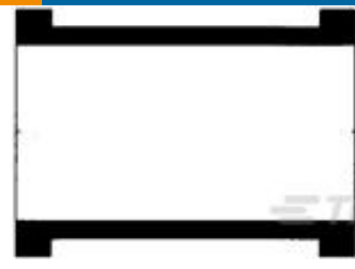
TE 产品编号342759-000 202W312-12-0