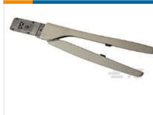
TE 产品编号1901611-1 CCII PIDG STRATO 24-20 ASSY