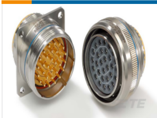
TE 产品编号ZPF000000000007489 983-0SE 10-05 PN