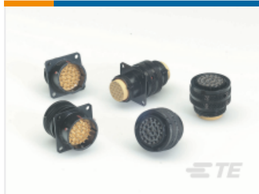
TE 产品编号ZPF000000000018665 FDBA 50-8-3A-PN-K