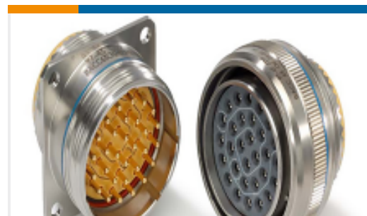
TE 产品编号ZPF000000000008202 983-6KE 10-05 SN