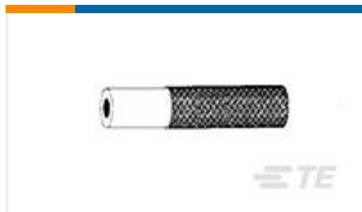
TE 产品编号0059013002 RAY-101-20.0(50)