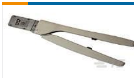
TE 产品编号1901600-1 CCII PIDG STRATO 18-16 ASSY