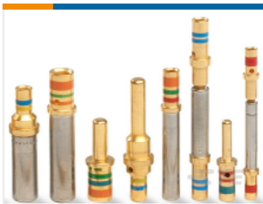
TE 产品编号ZPF000000000000713 029-0101-22