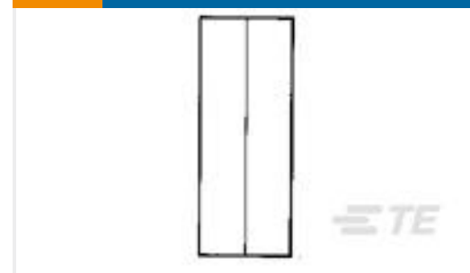
TE 产品编号34318 SPLICE,SOLIS PARA 8