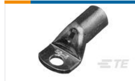
TE 产品编号709822-2 XCT 185-12