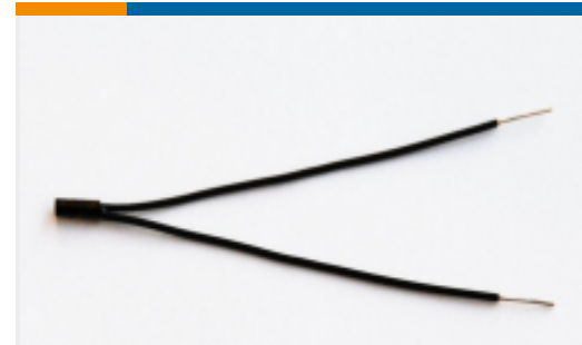
TE 产品编号GA10K3MBD1 MBD9-PROBE