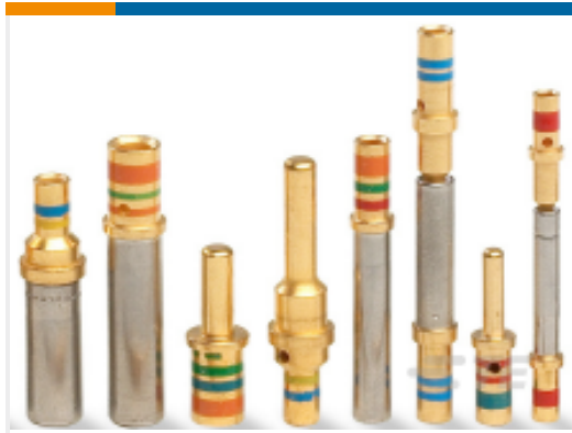
TE 产品编号 ZPF000000000000418 006-1159-12 A