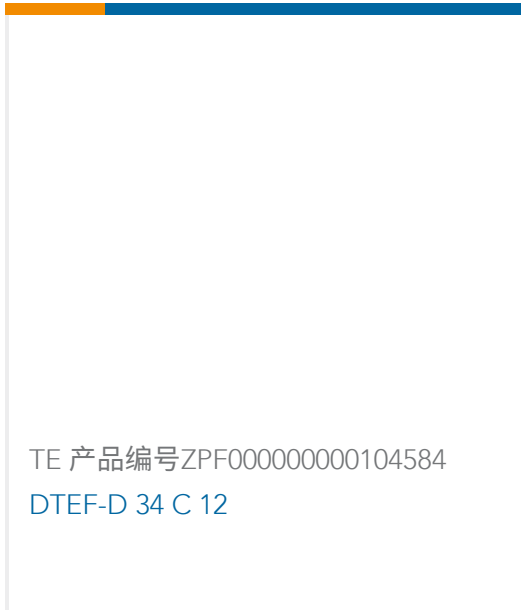
TE 产品编号 ZPF000000000104584 DTEF-D 34 C 12