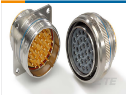
TE 产品编号 ZPF000000000138055 983-OSE 24-43 SN-L