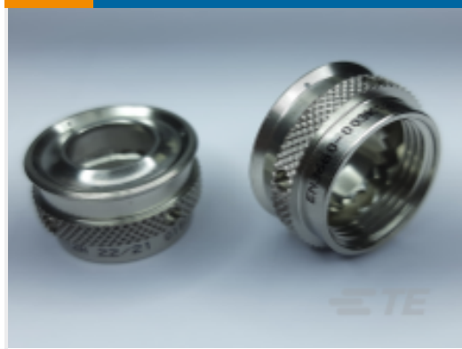
TE 产品编号 2275318-8 ASSY,EN3660-003, AL-ANOD BACKSHELL,SZ22