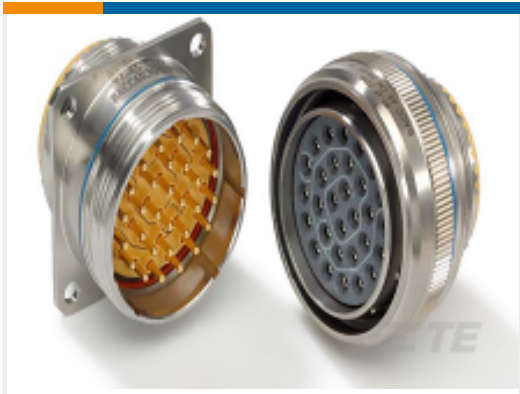
TE 产品编号 ZPF00000000009155 983-7WS 20-28 SN-L