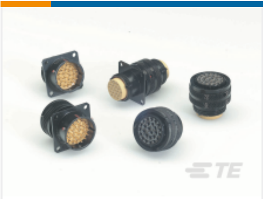
TE 产品编号 ZPF00000000018019 FDBA 50-12-3 SN-K 090