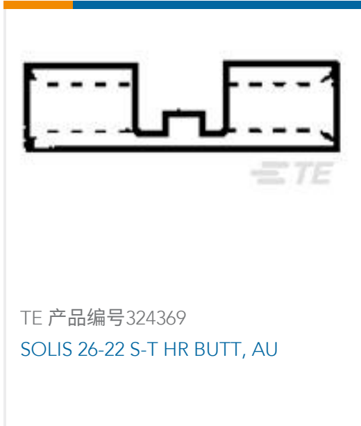
TE 产品编号 324369 SOLIS 26-22 S-T HR BUTT, AU