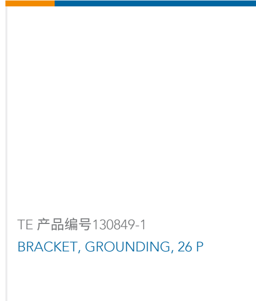
TE 产品编号 130849-1 BRACKET, GROUNDING, 26 P