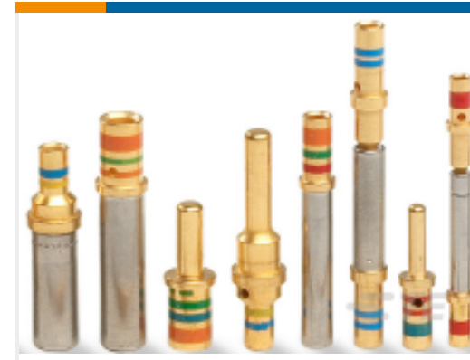
TE 产品编号 ZPF0000000000003625 724-1063-16