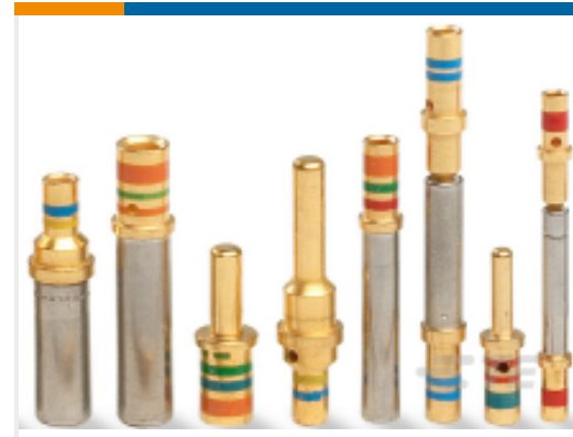
TE 产品编号 ZPF0000000000003604 724-0007-16