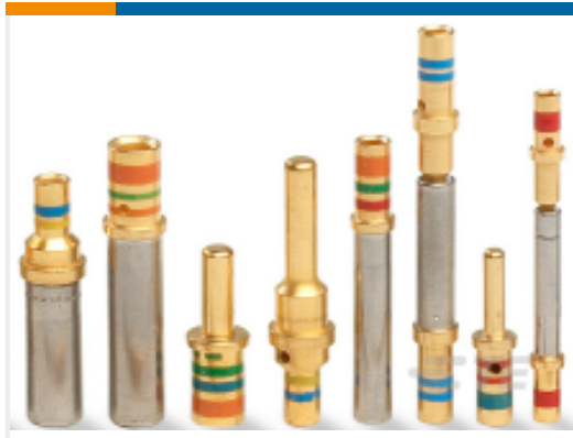
TE 产品编号 ZPF0000000000003591 724-0001-16