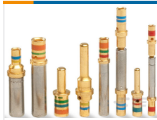
TE 产品编号 ZPF000000000000375 006-0973-20