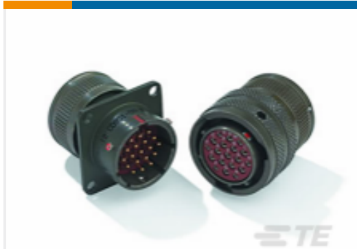
TE 产品编号ZPF000000000006526 951-06 R 10-6 S 50 A5295