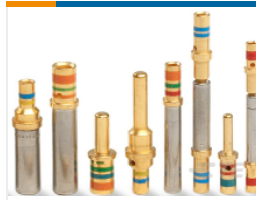
TE 产品编号ZPF000000000003607 724-0007-22