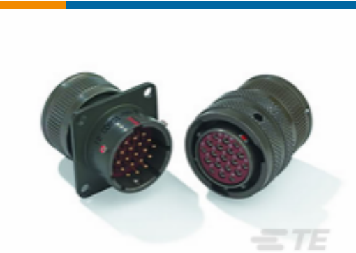
TE 产品编号ZPF000000000006527 951-06 R 10-6 S 50 A5654