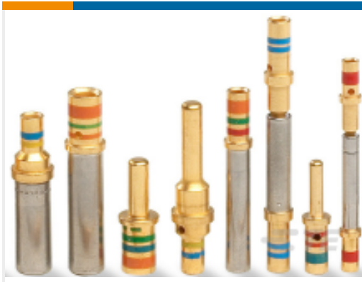
TE 产品编号ZPF000000000003604 724-0007-16