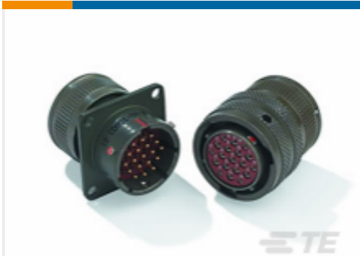
TE 产品编号ZPF000000000006528 951-06 R 10-6 S 50 A5949