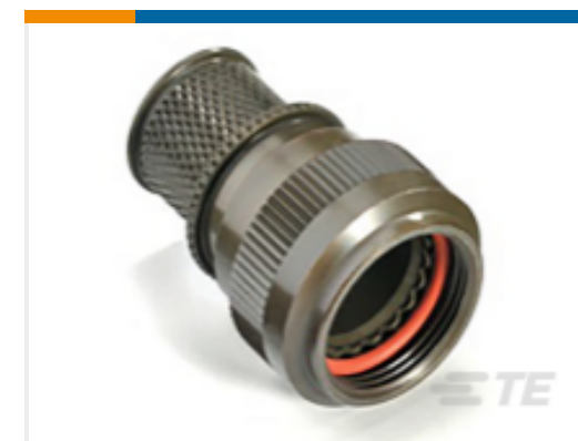
TE 产品编号EK4878-000 BTH1-09-04-1-B-SB