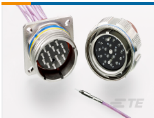
TE 产品编号 YMC8016-Z-25-32SN0 ARINC 801, TYPE 1 PLUG CONNECTOR