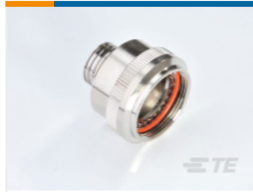
TE 产品编号EK3748-000 70H1-17-12-1-B