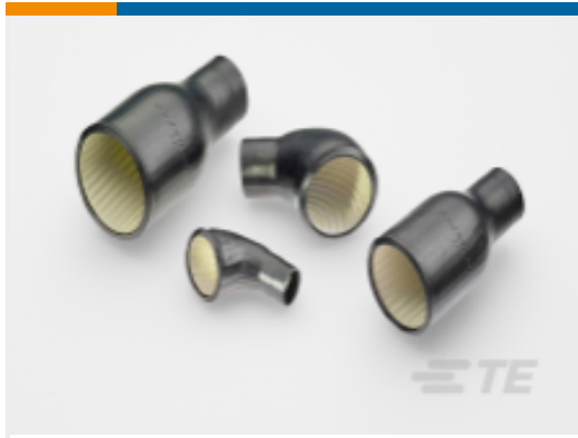
TE 产品编号EM3624-000 214A032-25C-0