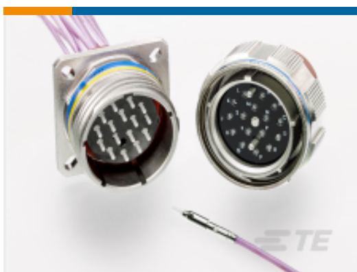
TE 产品编号 YMC8010-F-21-16PN0 ARINC 801, REC