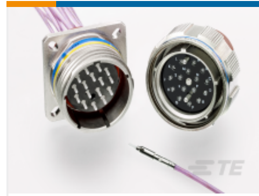
TE 产品编号YMC8016-W-13-04SN0 ARINC 801, TYPE 1 PLUG CONNECTOR