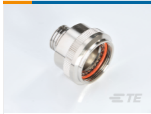
TE 产品编号EK4774-000 70H1-11-06-1-B