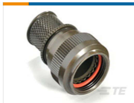
TE 产品编号EK4878-000 BTH1-09-04-1-B-SB