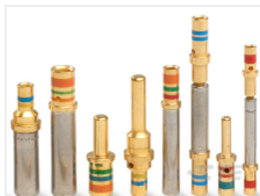
TE 产品编号2562-201-2031L CONT SOC ASSY