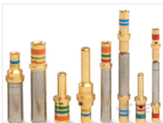
TE 产品编号2560-201-2031L CONT PIN