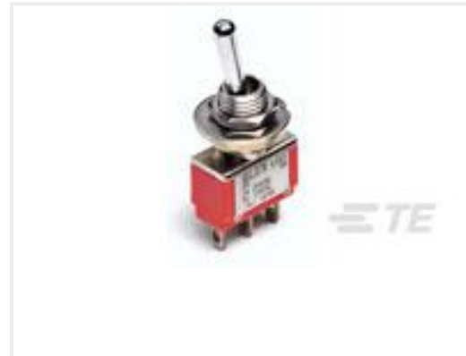
TE 产品编号2-1825138-8 A201SYZQ04