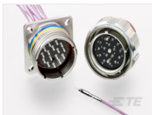
TE 产品编号 YMC8017-F-13-04PN0 ARINC 801, TYPE 1 JAM NUT CONNECTOR