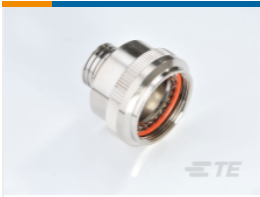
TE 产品编号EK4774-000 70H1-11-06-1-B