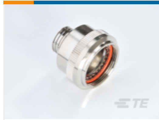
TE 产品编号EK3748-000 70H1-17-12-1-B