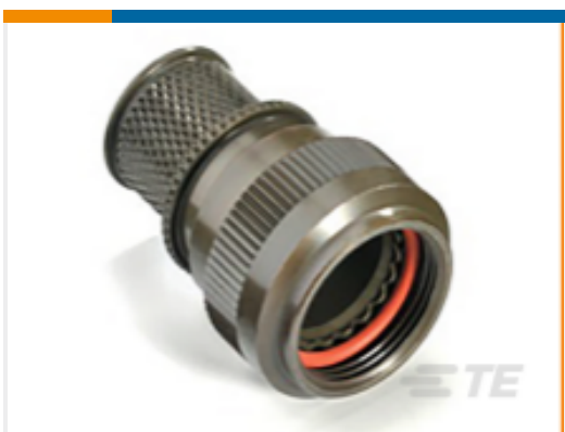
TE 产品编号EK4878-000 BTH1-09-04-1-B-SB