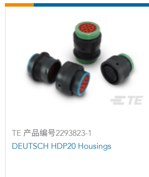
TE 产品编号2293823-1 DEUTSCH HDP20 Housings