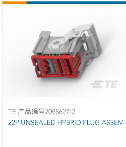
TE 产品编号2098627-2 22P UNSEALED HYBRID PLUG ASSEM