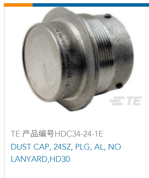
TE 产品编号HDC34-24-1E DUST CAP, 24SZ, PLG, AL, NO LANYARD,HD30