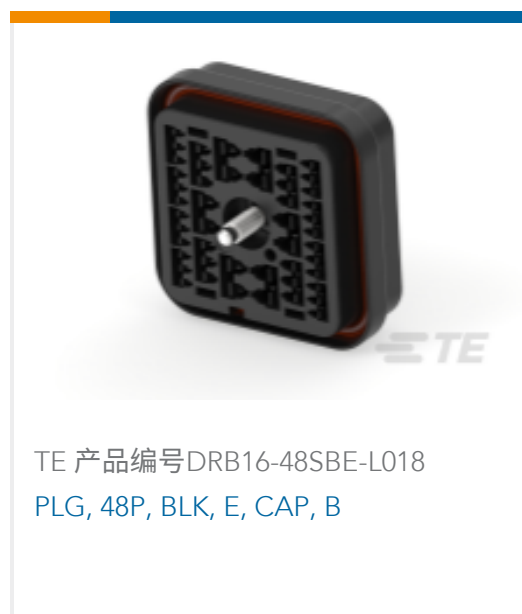
TE 产品编号DRB16-48SBE-L018 PLG, 48P, BLK, E, CAP, B