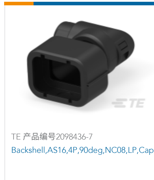
TE 产品编号2098436-7 Backshell,AS16,4P,90deg,NC08,LP,Cap