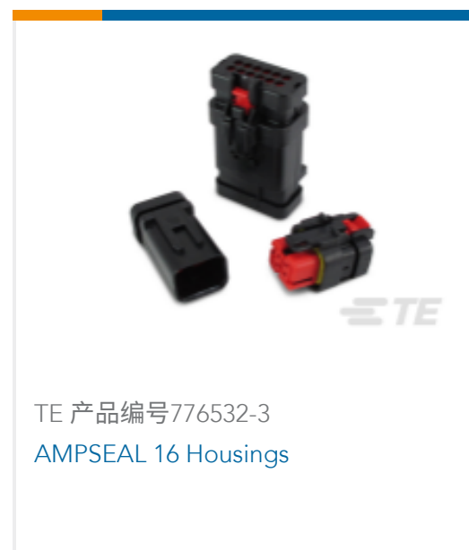
TE 产品编号776532-3 AMPSEAL 16 Housings