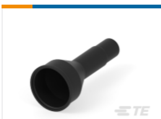
TE 产品编号HD10-9BT-BK BOOT, 9P, PLG/REC, ST, BLK