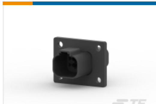
TE 产品编号DT04-4P-CL06 REC, 4P, BLK, E, FLANGE