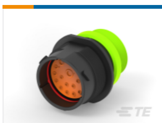
TE 产品编号HDP24-24-18PN-L015 REC, 18P, BLK, N, THD, 8/12/16, P