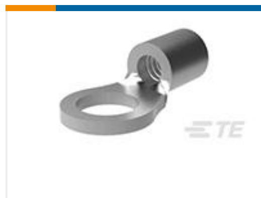
TE 产品编号8-33469-2 TERMINAL, SOLIS R 4 1/4