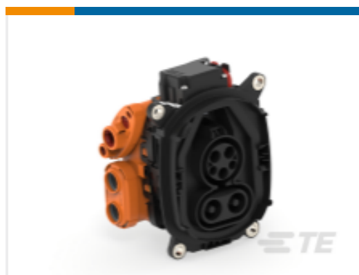
TE 产品编号2375501-1 CHARGE INLET, COMBO 1, 90 DEGREE