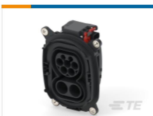
TE 产品编号9-2337016-2 COMBO 2, CHARGE INLET ASSY, GENERAL