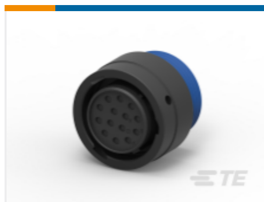
TE 产品编号YHDP26-18-14SEL024 PLG, 14P, BLK, E, WTHD, 16, S