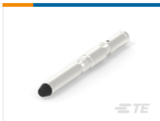
TE 产品编号2293269-3 DIA 6MM, PIN TERMINAL