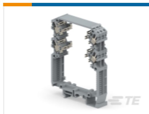
TE 产品编号1SNA116522R0700 BFU2.S12.G