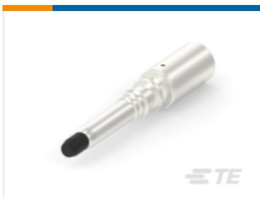
TE 产品编号2292542-1 PIN DIA 8.0 CONTACT ASSY TYP2