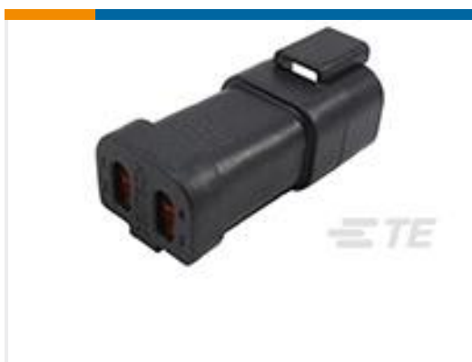
TE 产品编号DT04-4P-E005 REC, 4P, BLK, N, CAP