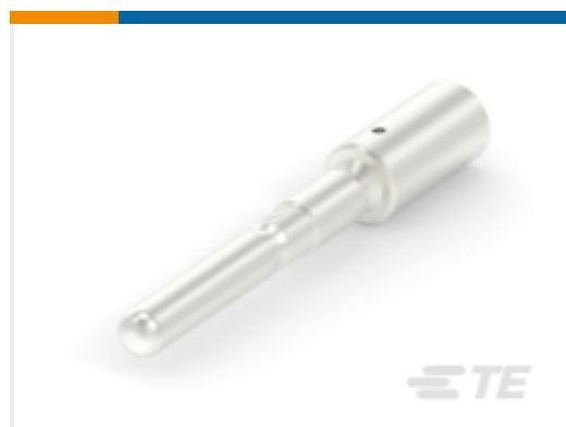
TE 产品编号2293270-5 PIN DIA 6.0, RIGID, POWER PE