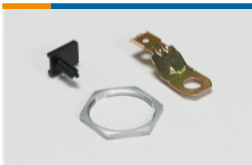
其他汽车连接器附件(5)