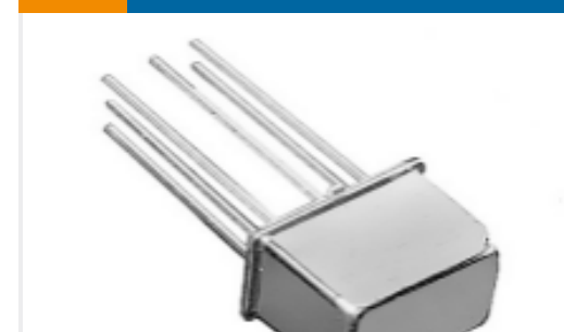
TE 产品编号1617147-5 JMGAP-26P = M39016/17-030P