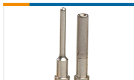
TE 产品编号ZPF0000000000001261 097-0267-16 A1267