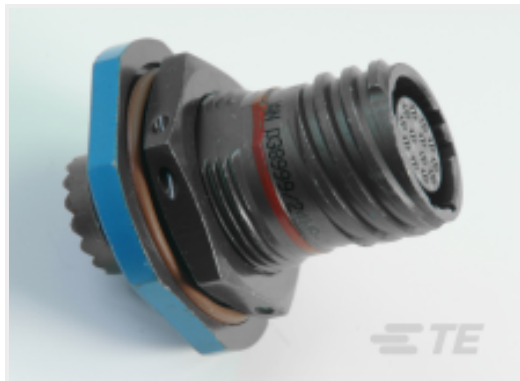
TE 产品编号 CAT-D38999-DTS17S Jam Nut: D38999, 23-53 Insert, Black Zinc Nickel Plating