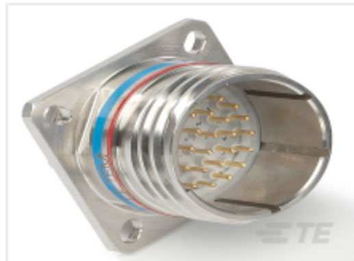
TE 产品编号 CAT-D38999-DTS9D D38999: 方形凸缘, 23-53 插件