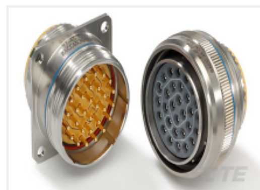
TE 产品编号ZPF000000000007174 983-ORS 08-98 PN