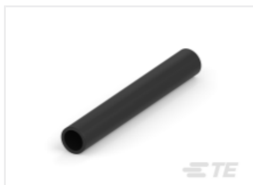
TE 产品编号CAT-HST-BSTS BSTS/BSTS-FR 热缩管