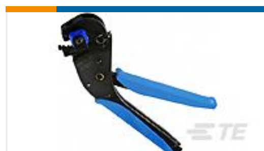
TE 产品编号58078-3 TETRA CRIMP FRAME W/O DIES