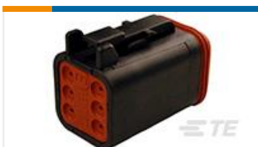
TE 产品编号DT06-6S-CE06 PLG, 6P, BLK, E, SEAL RET