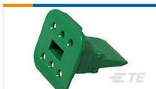
TE 产品编号W6S-P012 WEDGE LOCK, 6P, PLG, GRN, SL RET, DT