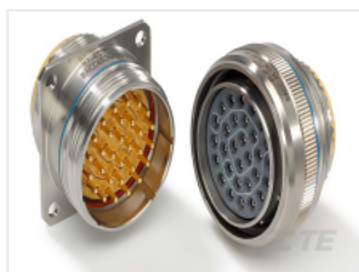
TE 产品编号 ZPF000000000007174 983-0RS 08-98 PN