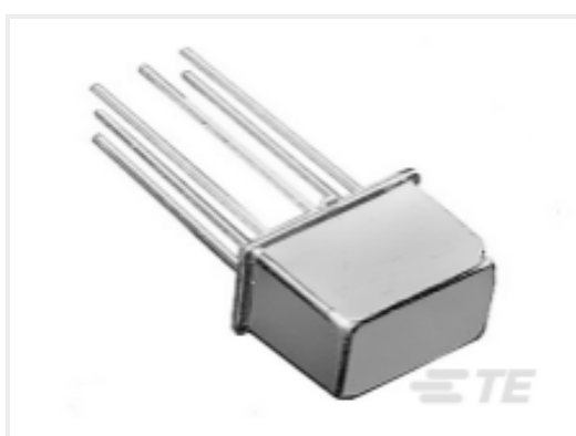
TE 产品编号 1617147-5 JMGAP-26P = M39016/17-030P