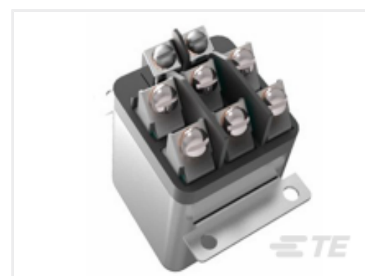
TE 产品编号 1617807-5 FC-335-SY8= RELAY, 3PST