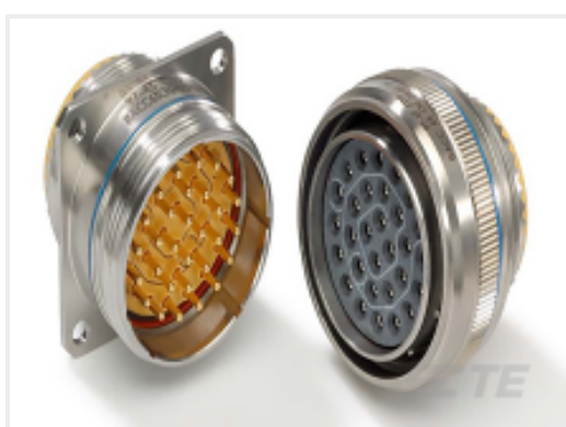
TE 产品编号 ZPF000000000007174 983-ORS 08-98 PN