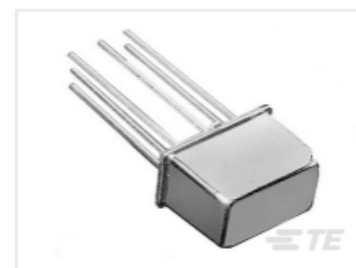
TE 产品编号 1617147-5 JMGAP-26P = M39016/17-030P