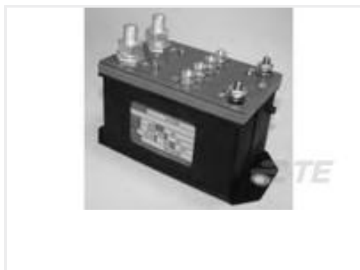
TE 产品编号 1616058-6 A703CD (FAA/PMA)=RELAY