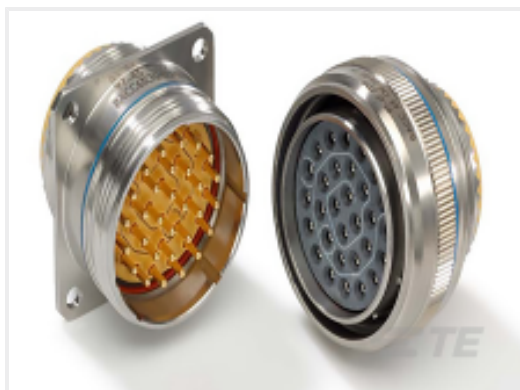
TE 产品编号 ZPF000000000007174 983-ORS 08-98 PN