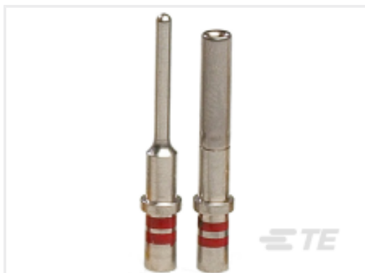
TE 产品编号 ZPF000000000001261 097-0267-16 A1267