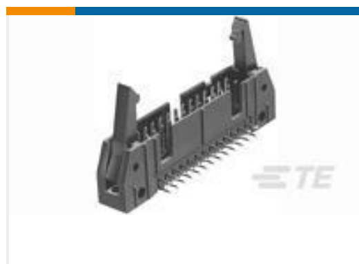
TE 产品编号1-5499141-1 A/L UNIV HDR 60P RA LG LAT