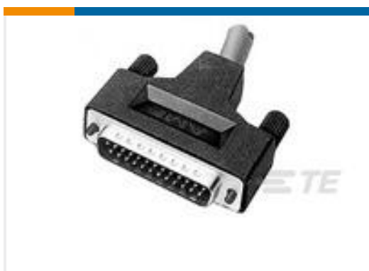
TE 产品编号1-747944-6 KIT, PLUG, 9P, HDE, SHLD ENCLSR