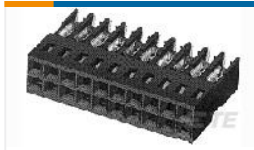
TE 产品编号6-102398-8 40 AMPMODU MT ASSY DR .100CL