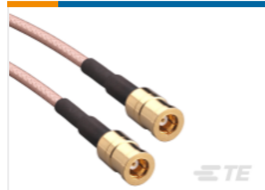
TE 产品编号CSE-SMBM-152-SMBM SMB to SMB 152mm RG316