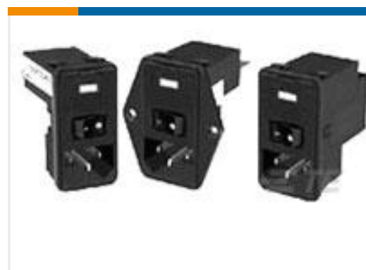
TE 产品编号6609100-1 PE0SS000=C1137