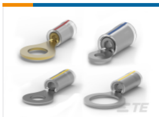
TE 产品编号53416-1 PIDG Radiation Resistant C Rings / Spades