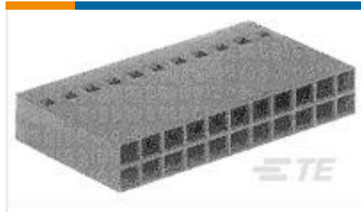
TE 产品编号1-104482-4 32 SHORT PT RCPT HSG DR .100CL