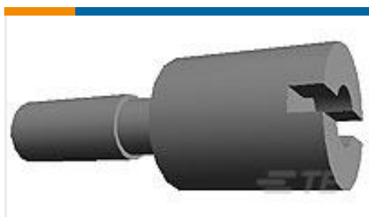
TE 产品编号787004-3 .8MM SCREWLOCK BRDMT,BULK