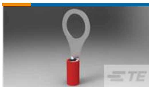
TE 产品编号320572 PIDG R 22-16COMM 22-18MIL 5/16