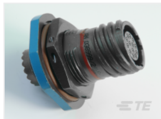
TE 产品编号 CAT-D38999-DTS17C Jam Nut: D38999, 17-06 Insert, Black Zinc Nickel Plating