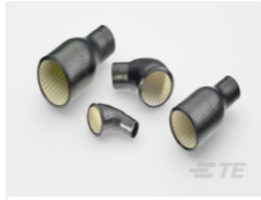
TE 产品编号EK7310-000 222S142-25C-0