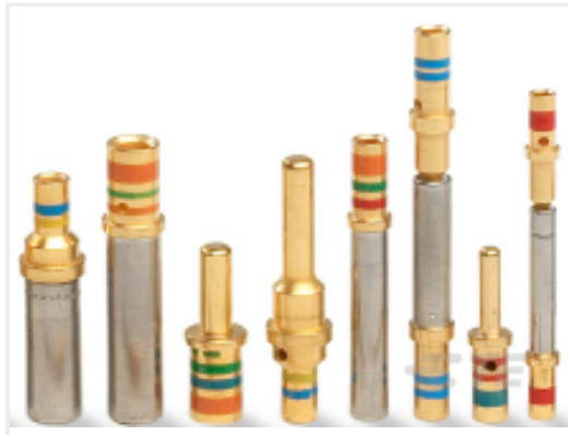
TE 产品编号4109-207-2000L CONT SOC ASSY