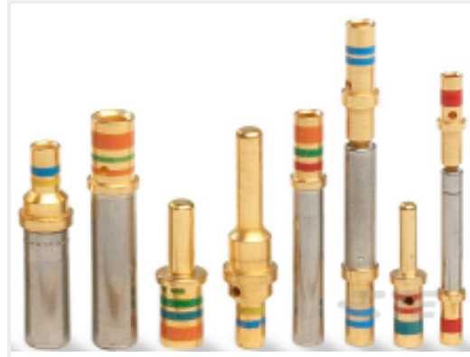
TE 产品编号4160-202-2031L CONT PIN