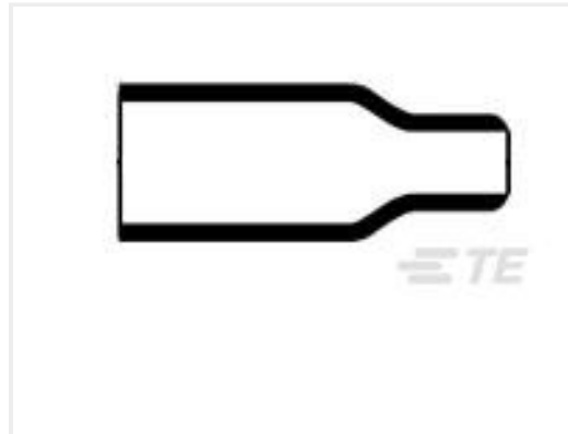
TE 产品编号806606-000 202A153-25-0