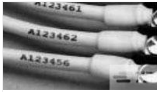
TE 产品编号5053222025 RNF-100-1/2-6-STK