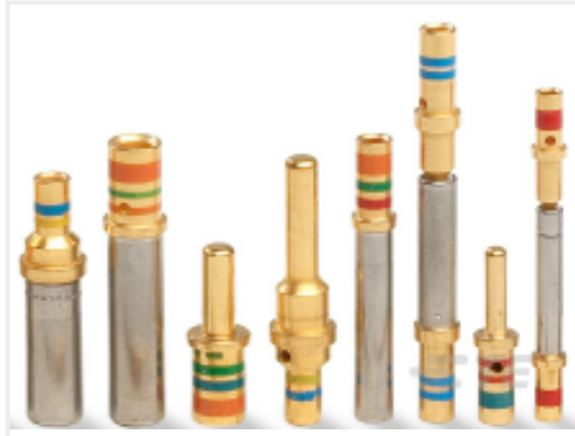
TE 产品编号1841-1-5616 CONT PIN