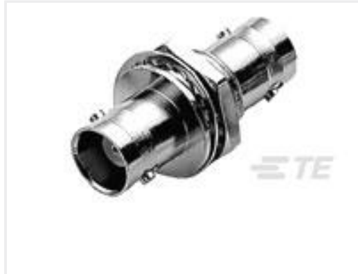
TE 产品编号330024 BNC BHD JACK ADAPTER