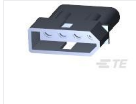
TE 产品编号770078-1 04P .093 COMM P&S PLUG HSG