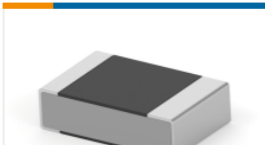
TE 产品编号5-2176272-3 RU 0805 10K 0.01% 2PPM 1K RL