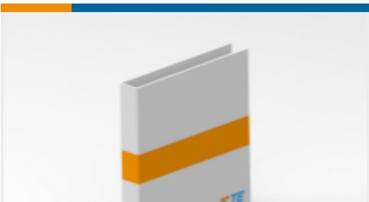
TE 产品编号2176439-2 CRGH 0603 1% 10R-1M0 LAB-KIT