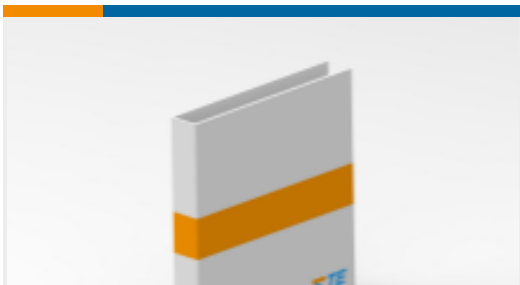
TE 产品编号2176439-1 CRGH 0402 1% 10R-1M0 LAB-KIT