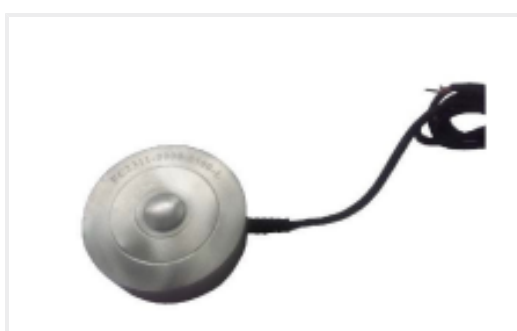
TE 产品编号 FC2311-0000-1000-L FC23 MV 2FT CABLE 1000L