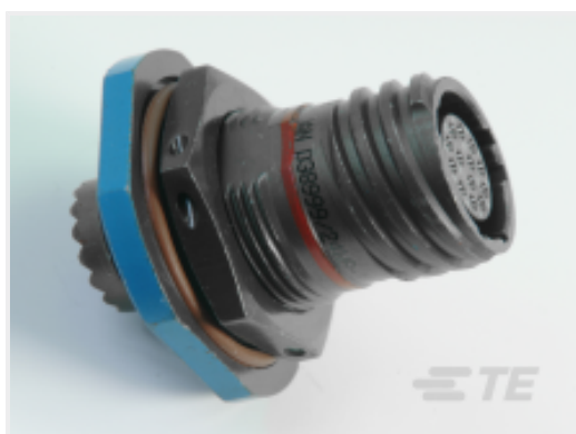
TE 产品编号 YDTS24Z17-06BBV001 RECP ASSY