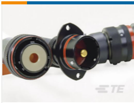
TE 产品编号ASHD022-24320SA016 RECEPT.ASSY.ASHD. 24320 PLANFORM. 16MM C