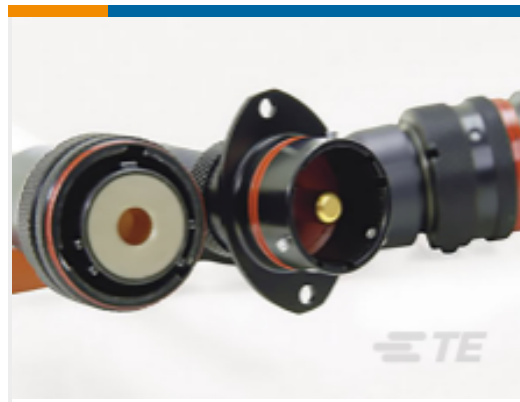
TE 产品编号ASHD622-24320PA016 PLUG ASSY.ASHD. 24320 PLANFORM. 16MM CRI