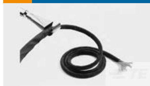
TE 产品编号CB7764-000 RW-200-1/8-0-SP