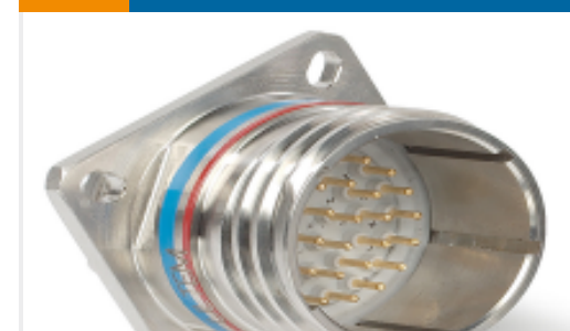
TE 产品编号YDTS20F09-35PAV001 RECP ASSY