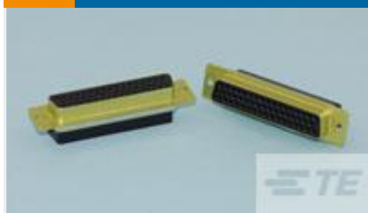
TE 产品编号1658640-2 RECP. ASSEMBLY SIZE 5