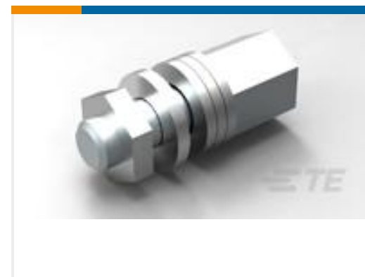
TE 产品编号5205817-8 KIT SCREWLOCK FEMALE