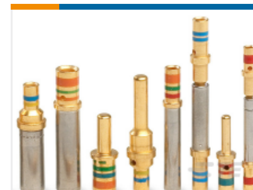
TE 产品编号38941-22L CONTACTS