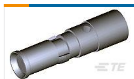
TE 产品编号212008-1 CONTACT, SKT, PWR 8