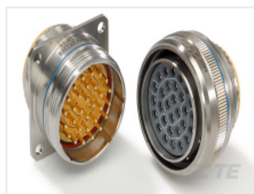
TE 产品编号 ZPF0000000000007174 983-0RS 08-98 PN