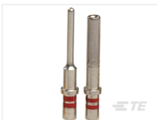
TE 产品编号 ZPF000000000001261 097-0267-16 A1267