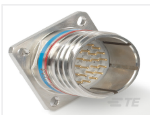
TE 产品编号 YDTS20Z13-08AEV001 RECP ASSY