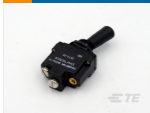
TE 产品编号K1007153 单板拨动开关，密封，杠杆，拨动，塑料杠杆