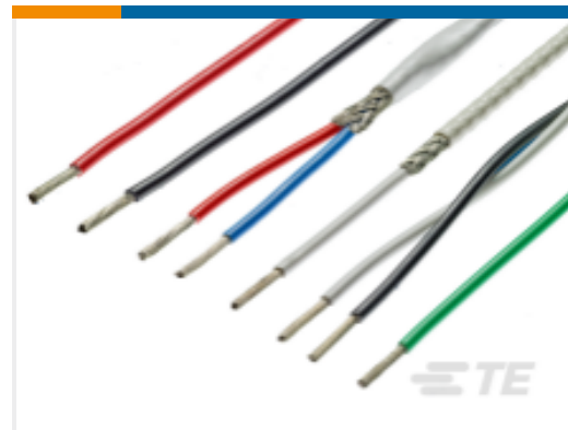
TE 产品编号CT73983001 99M0111-16-45CK0001