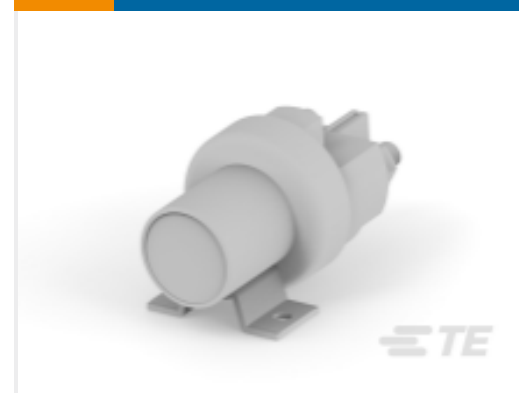
TE 产品编号K1008699 Relay 26-60-05